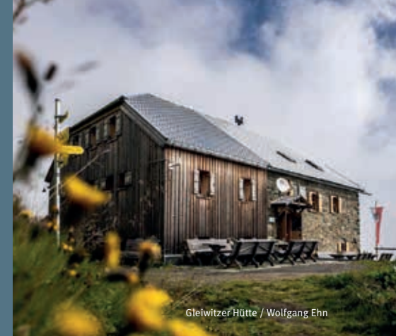
Gleiwitzer Hütte / Wolfgang Ehn

Mit der Bahn entspannt und klimafreundlich anreisen und dafür eine freie Übernachtung im Lager abstauben. Am nächsten Morgen als Erste*r oben auf dem Gipfel stehen und die Ruhe genießen. Die Aktion ›Freie Nacht fürs Klima‹ macht's möglich.