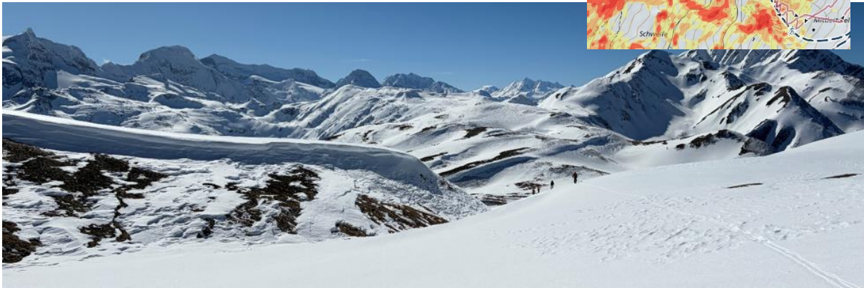
Topo und Foto: Heinz Baumann